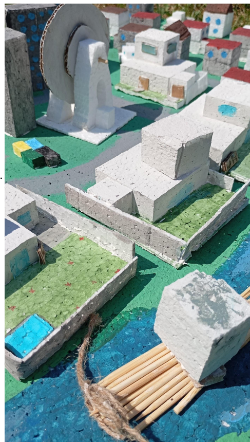
Neostali sme iba pri interiéroch. Farebné mesto, urbanistická štúdia