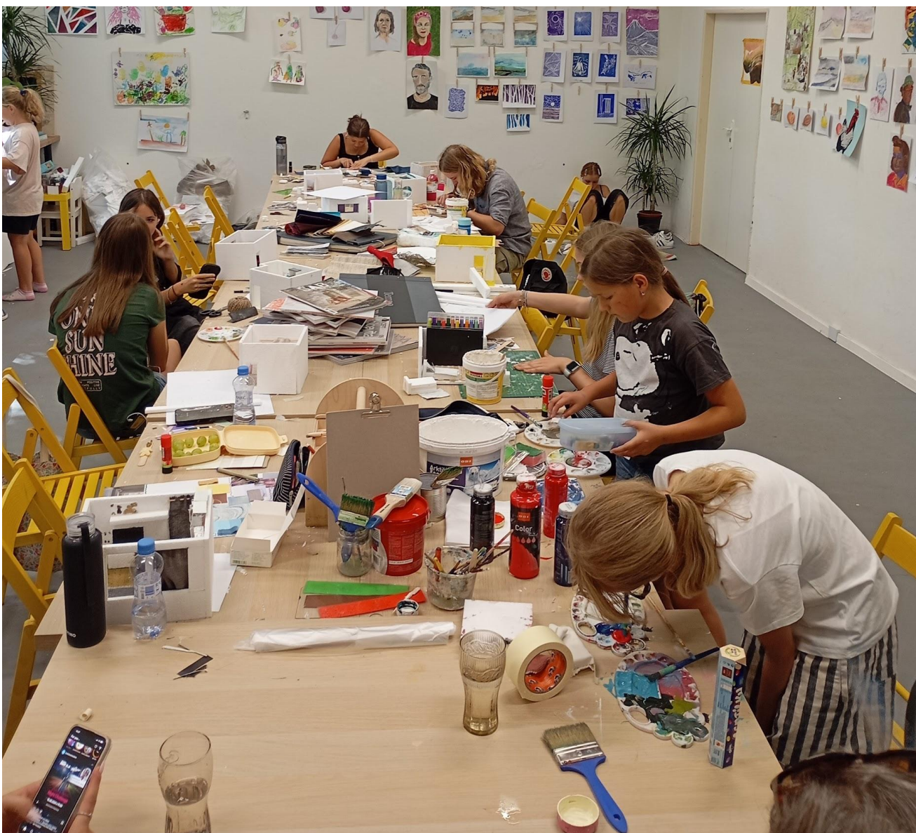
Farby, látky, tapety, rezače, lepidlá, časopisy, ale aj odpad či kúsky prírody. Pri tvorbe sme použili skoro všetko. Aj mobily!

Workshop podporoval rozvoj manuálnych zručností, zmysel pre detail a tiež tímovú prácu, pričom výsledkom boli premyslené modely plné osobitého čara.