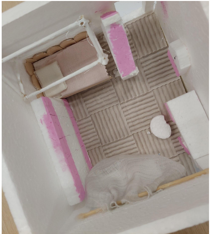
Lucia šperkuje detaily a chráni sa pred komármi baldachýnom

Zoe, 10: I like, there are a lot of materials to use and experiment with.