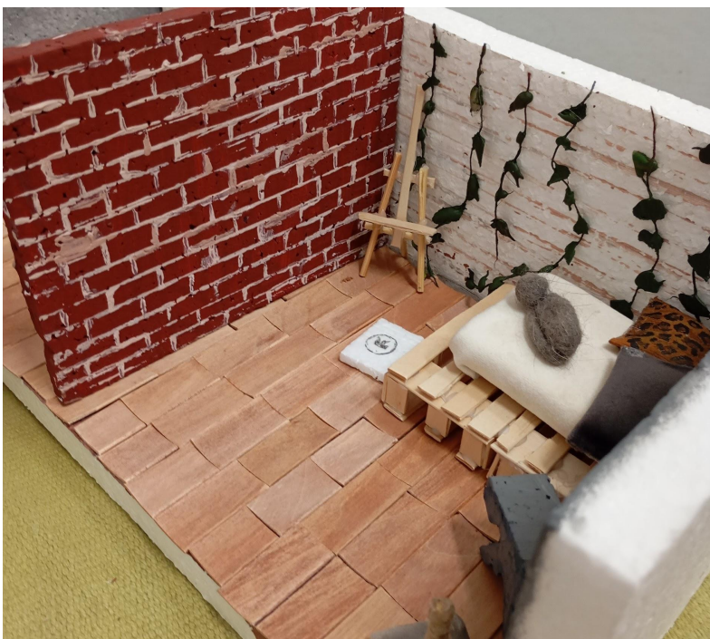
Biofília aj premyslené detaily podľa Niny