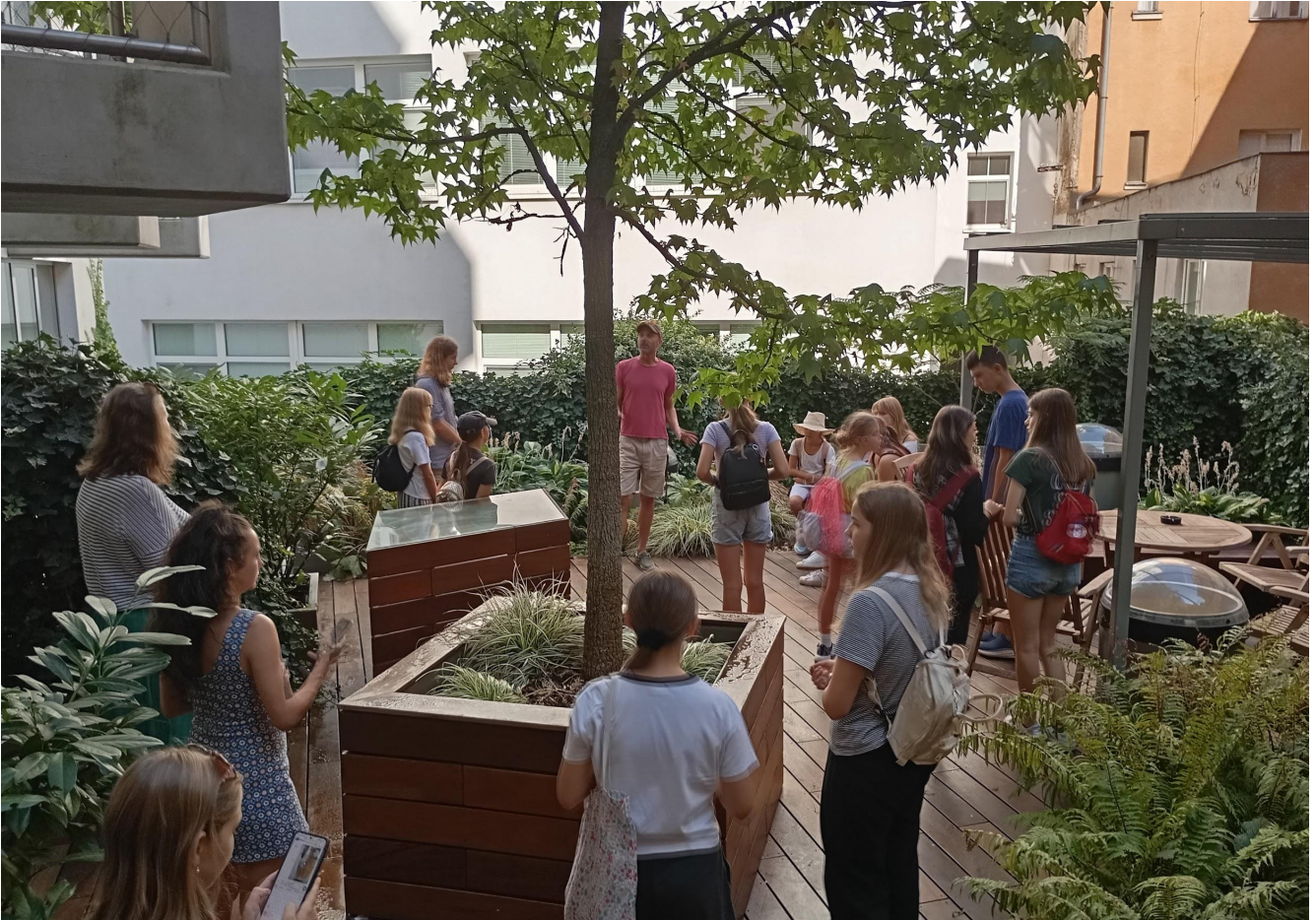
Vnútročné átrium budovy ITB Wallenrod nás prenieslo z mesta do zelenej oázy s "bublinami"