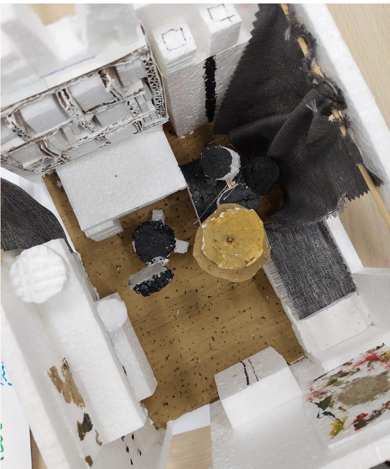
Hudobný Interiér mojej izby podľa Nelky